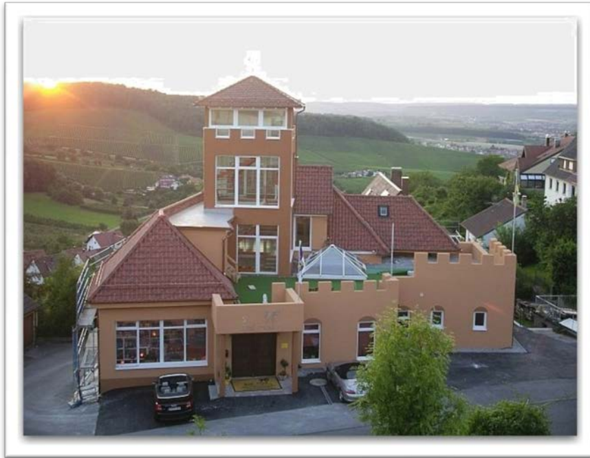
Das Burnout-Helpcenter in Löwenstein

Nachfolgend finden Sie abgestimmte Lösungen, die Ihnen helfen, die psychische Gefährdungsbeurteilung professionell und erfolgreich zu realisieren. Dabei steht im Vordergrund, dass das Ergebnis nach allen Seiten gerecht werden muss: Den Anforderungen des Gesetzgebers, den Wünschen des Arbeitgebers, den Belangen des Arbeitnehmers und den Erwartungen von Bewerbern.